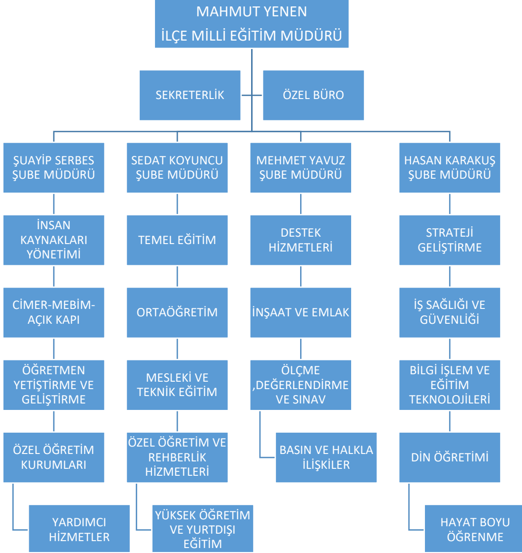
Şekil 2: Teşkilat yapısı