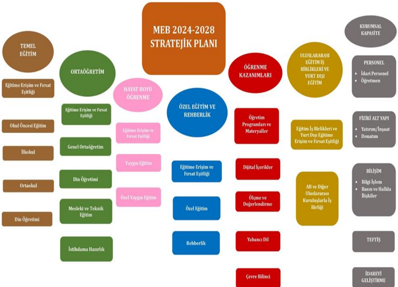
Şekil 3: Millî Eğitim Bakanlığı 2024-2028 Stratejik Plan Diyagramı

Hedef 6.5: Etkili bir izleme ve değerlendirme süreciyle beraber alınan kararları rasyonel hâle getirmek; birimler arası iletişimi güçlendirmek ve iş birliğini teşvik etmek için uygun iletişim kanalları ve araçları kullanılacak, teknolojik altyapı yatırımlarıyla kurumsal kapasite daha verimli hâle getirilecektir.